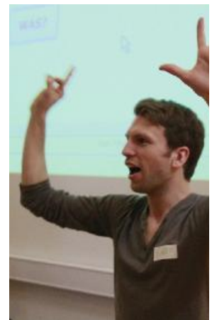
"Und jetzt alle!"