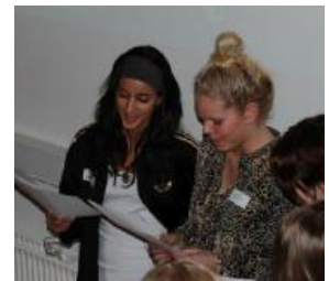
"Eins, zwei, drei, vier . . ."